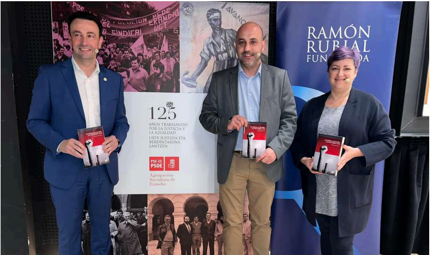
Socialistas en Erandio. 125 años (1896-2021)